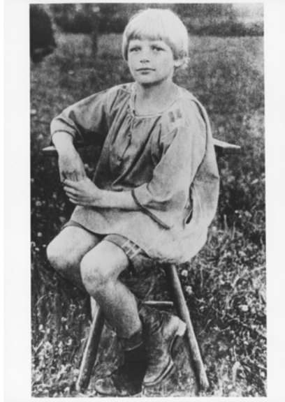
7 Dietrich Bonhoeffer 1917