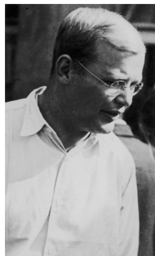
24 Dietrich Bonhoeffer im August 1935