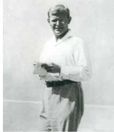
20 Dietrich Bonhoeffer während der Jugendkonferenz in Gland am Genfer See, 1932