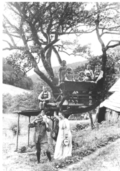
4 Die Familie, Wölfelsgrund, Juli 1911