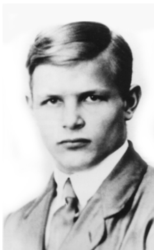
11 Dietrich Bonhoeffer als Student, 1923