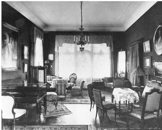
9 Das Wohn- und Musikzimmer der Familie Bonhoeffer