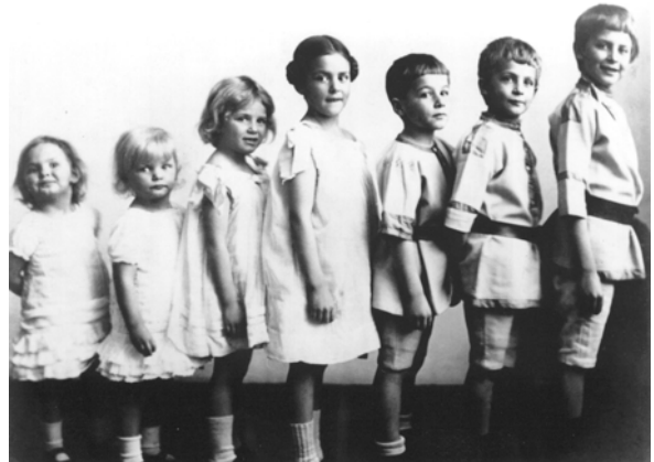
2 Die Geschwister um 1908