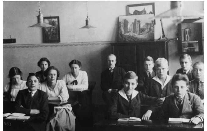
10 Klasse O II des Grunewald-Gymnasiums 1920/21