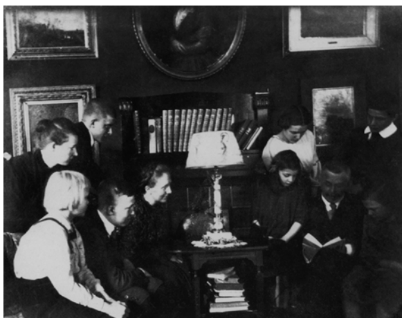
5 Leseabend im Hause Bonhoeffer um 1913