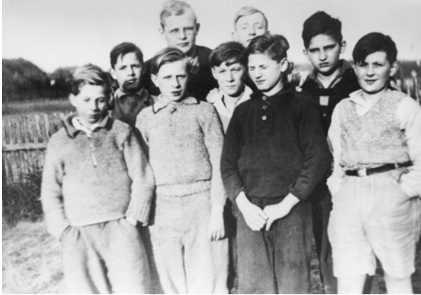
19 Dietrich Bonhoeffer mit einer Berliner Konfirmandengruppe in Friedrichsbrunn, Ostern 1932