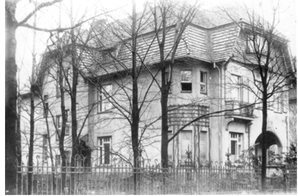
8 Das Elternhaus in Berlin-Grunewald 1916