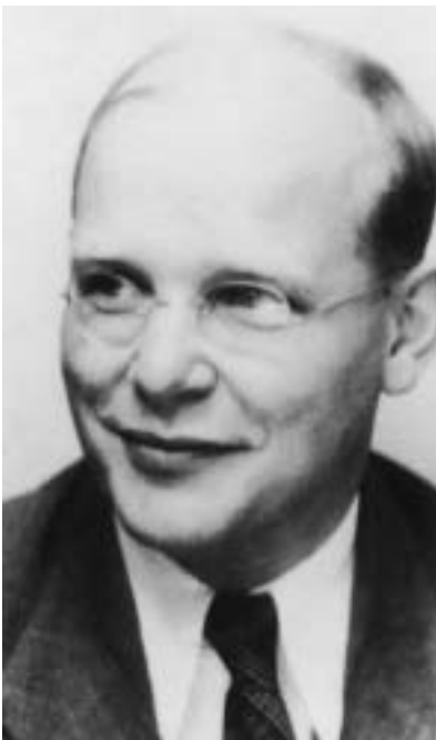
Bonhoeffer als 36-Jähriger 1942 in Zürich.