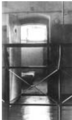
In diese Zelle führte der Widerstand. Später in den Tod.

Nach dem Krieg wurde der Verschwörer Bonhoeffer – auch in der Kirche – noch lange als «Verräter» betrachtet. Es hiess, die Kirche könne die damalige Verschwörung gegen Hitler